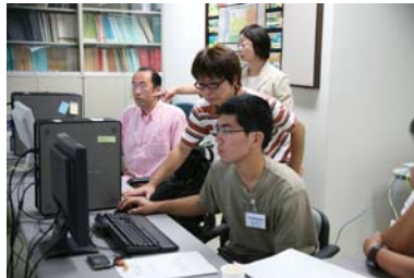
写真4 解析・シミュレーション課題の様子