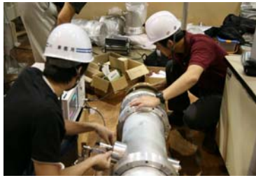
写真3 実験課題の様子