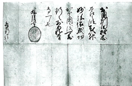
「織田信長朱印状」(当館蔵)

正式名称は、総合研究大学院大学(総研大) 先端学術院先端学術専攻 日本歴史研究コース。1999年に、国立歴史民俗博物館(歴博)に設置された、博士後期課程のみの大学院です。