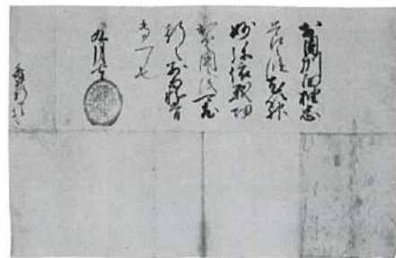
「織田信長朱印状」(当館蔵)

論文作成で必要な物品等の購入費のほか、国内外の調査・学会参加旅費を補助する制度があります。また、歴博の共同研究や総研大のRA(リサーチ・アシスタント)等、さまざまなプロジェクトの補助業務の機会があります。