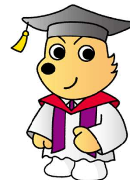
情報犬 ビットくん