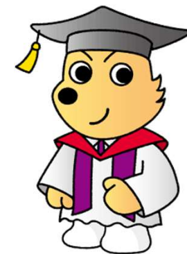
情報犬 ビットくん